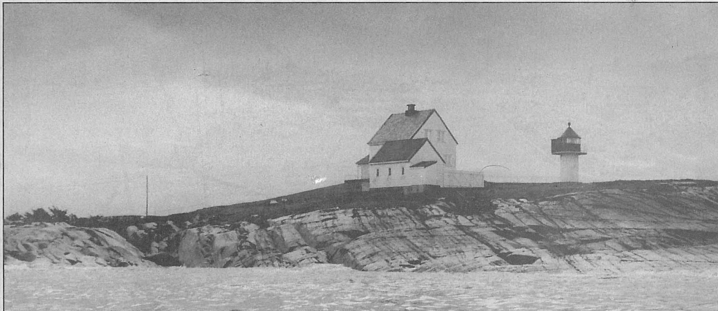
Flatholmen fyr, to kilometer sjøvei ut av Tananger, ble opprettet i 1862.