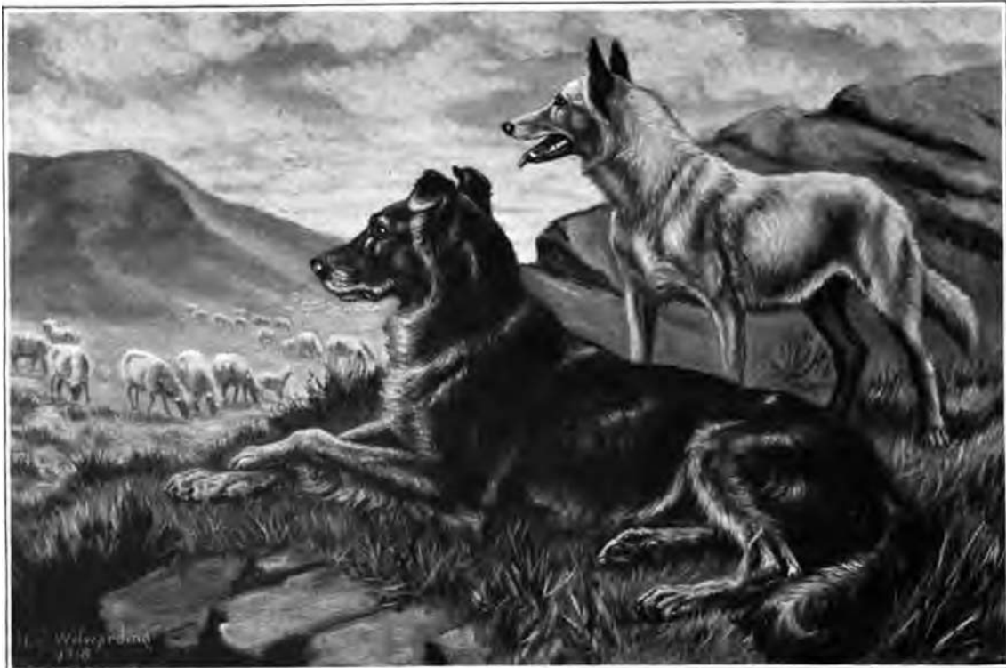
"Sport" og "Midget"

Hvis jeg ropte til den i en hard tone, fikk den opp litt mer stim til den var ute av syne. Stundom utførte den sitt arbeid og kom luskende tilbake en annen vei. Stundom kom den ikke tilbake, men la seg et eller annet sted i skyggen av en tue. Nesten alltid kom den diltende bak meg når jeg gikk; men det hendte at den ikke kom, hvis den trodde jeg var sint på den, og flere ganger så jeg den ikke igjen før om kvelden. —